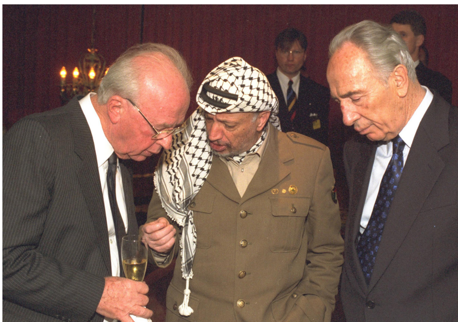
משמאל לימין: ראש הממשלה יצחק רבין, יו"ר אש"ף יאסר ערפאת ושר החוץ שמעון פרס