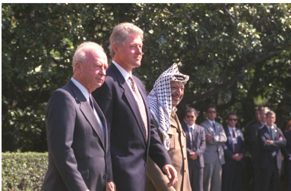
משמאל לימין: ראש הממשלה יצחק רבין, נשיא ארה"ב ביל קלינטון ויו"ר אש"ף יאסר ערפאת

הרשות הפלסטינית מפרה את התחייבויותיה על פי הסכם אוסלו ללא הפסקה, למעשה מרגע חתימתו. ההפרות נוגעות לליבת ההסכמים ולרוחם ומקיפות תחומים מגוונים.