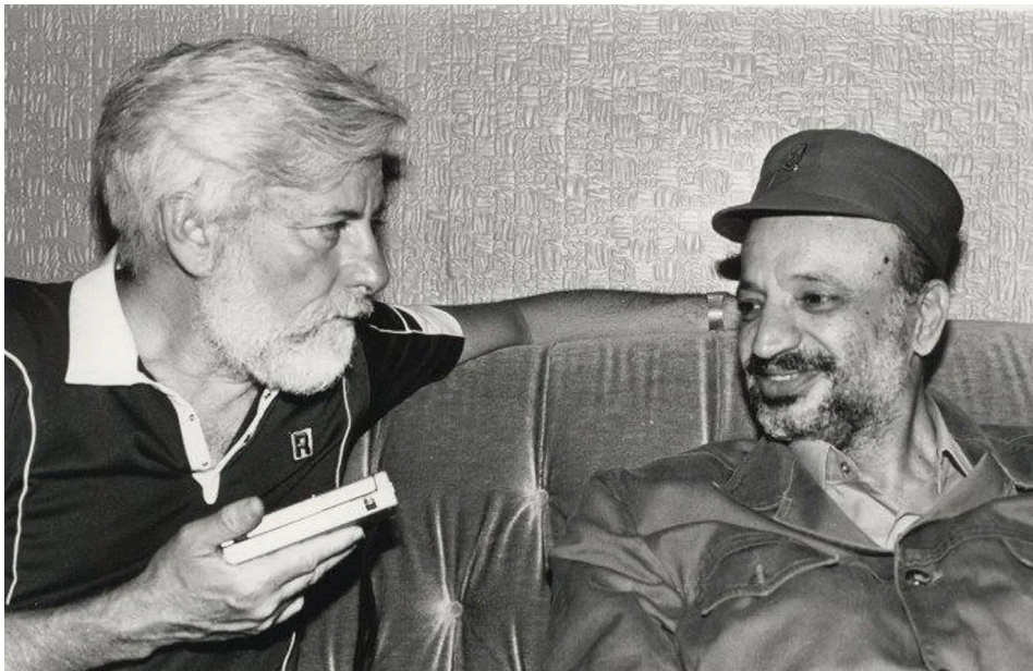
אורי אבנרי וערפאת בבירות, 1982

גיליתי את האמת על אמונתו המוצקה בזכויות הלגיטימיות של עמנו הפלסטיני, ואבנרי היה הראשון ששמעתי ממנו את המונח "מדינה פלסטינית עצמאית לצד מדינת ישראל"