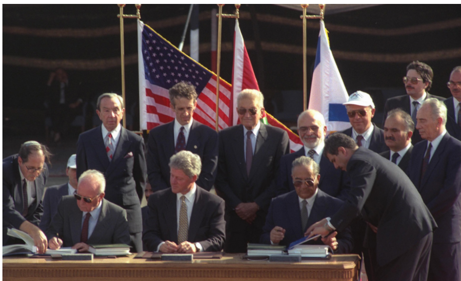
החתימה על הסכם השלום בין ישראל לירדן, 26 באוקטובר 1994

מכיוון שסוגיית ירושלים היא סעיף מוסכם על שולחן המשא ומתן בדבר מעמד הקבע, הסכמי אוסלו אינם מתייחסים כלל לתוצאות המשא ומתן בנושא זה, ואין בהם כל התחייבות או אזכור לסטטוס קוו ההיסטורי בנוגע למקומות הקדושים. למעשה, בהסכם השלום בין ישראל לירדן, מיום 26 באוקטובר 1994, ישראל הצהירה שהיא "מכבדת את התפקיד המיוחד של הממלכה ההאשמית של ירדן במקומות הקדושים לאיסלאם בירושלים. כאשר יתקיים המשא ומתן להסדר הקבע, ישראל תיתן עדיפות גבוהה לתפקיד ההיסטורי של ירדן במקדשים אלה" 18 . לפיכך יש להניח כי בכל משא ומתן אמיתי בעניין ירושלים יגבשו הצדדים, בין היתר, את הפתרון הראוי, המכובד והמוסכם של סוגיית המקומות הקדושים בירושלים, ובכלל זה הגישה אליהם לצורך תפילות וביקורים באתרים. פתרון כזה יצטרך להביא בחשבון באופן הגיוני את אופיים הייחודי של המקומות הקדושים, את הצורך לכבד את הרגישויות של הדתות השונות ולהגן עליהן, ואת