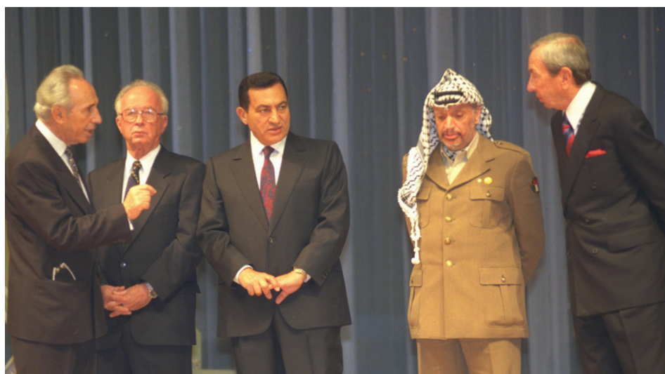
החתימה על הסכם קהיר, 4 במאי 1994. ראש ממשלת ישראל יצחק רבין גילה כי מנהיג אש"ף יאסר ערפאת לא חתם על מפה של יריחו בהסכם. ערפאת סירב במפגיע לחתום למרות הפצרותיהם של שר החוץ שמעון פרס, נשיא מצרים חוסני מובארק ושר החוץ של ארה"ב וורן כריסטופר. בסופו של דבר חתם ערפאת על המפה

עד להשלמת תוצאותיו המשא ומתן על מעמד הקבע של השטחים, הסכמי אוסלו הם מקור הסמכות החוקי, התקף והמוסכם הבלעדי לחלוקת השליטה, הסמכויות והאחריות על חלקים שונים של השטחים בין הפלסטינים לישראל. לפי חלוקה זו, מוסכם כי הרשות הפלסטינית תהיה הגוף המנהל ובעל הסמכויות, ובכללן סמכות השיפוט, האחראי על היישובים הפלסטיניים עתירי האוכלוסייה הנתונים לשליטתה (שטחי A ו-B). כמו כן מוסכם בין הצדדים כי ישראל מפעילה את סמכויות השלטון והשיפוט על שטח C המאוכלס בדלילות, ואשר בתחומיו נמצאים ההתנחלויות ומתקני הביטחון שלה, והיא האחראית עליו. שום מסגרת משפטית או נורמטיבית אחרת, אם באמצעות אמנות בינלאומיות ואם באמצעות הצהרות או החלטות של האו"ם, לא החליפה ולא יכולה להחליף את המסגרת המשפטית המוסכמת, שעודנה תקפה, של הסכמי אוסלו. לכן קיבלו הפלסטינים במלואה את העובדה כי עד להשלמת המשא ומתן על הסדר הקבע, לישראל השליטה וסמכות השיפוט המלאות על שטח C. מכאן שניסיונותיה של הרשות הפלסטינית, אם בעצרת הכללית של האו"ם ואם באמצעות הגופים השיפוטיים הבינלאומיים, לשנות מצב זה ולהשיג הכרה בינלאומית ולפיה ישראל היא "כוח כובש" ומעמד המשפטי של שטחים אלו הוא של "כיבוש לוחמתי", פגומים מבחינה משפטית ושגויים מיסודם.