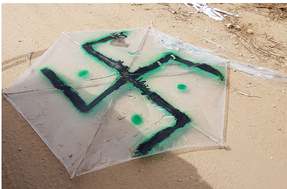
צלב קרס על עפיפון שהופרח בעזה

היה אפשר לקוות שהוועידה הראשונה של המאה ה-21 תקבל עליה כאתגר, אם לא למגר את הגזענות, לפחות לפרקה מנשקה. אבל במקום זאת האנושות הופכת לקורבן של סדר יום פוליטי... האם יש אירוניה גדולה יותר מעצם העובדה שוועידה שהתכנסה כדי להילחם בנגע הגזענות תצמיח את ההכרזה הגזענית ביותר מצד ארגון בינלאומי מרכזי מאז מלחמת העולם השנייה? 35