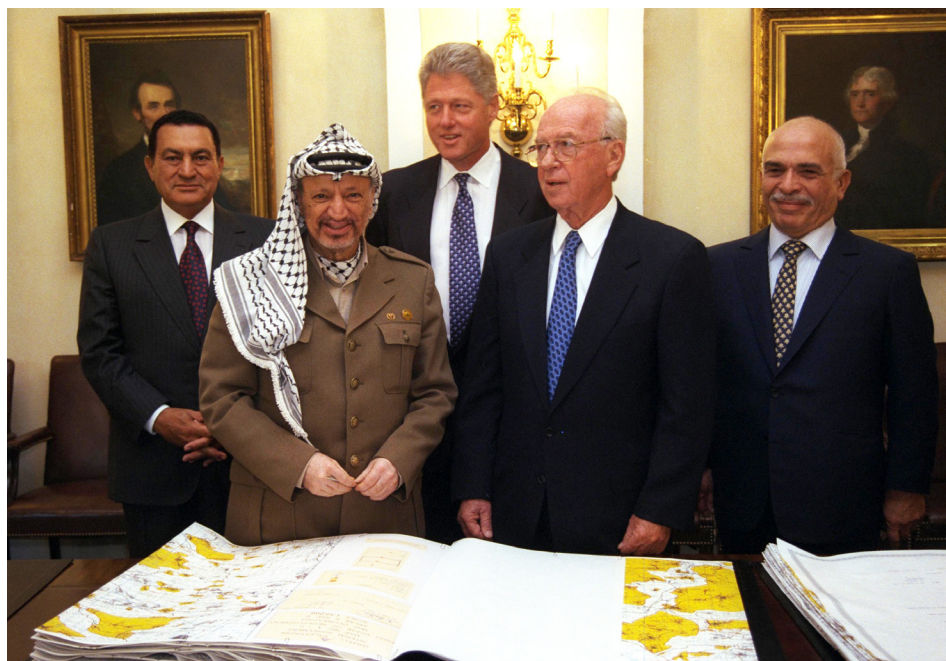
משמאל לימין: נשיא מצרים חוסני מובארכ, יו"ר אש"ף יאסר ערפאת, נשיא ארה"ב ביל קלינטון, ראש הממשלה יצחק רבין והמלך חוסיין בצילום רשמי בבית הלבן לאחר החתימה על הסכם הביניים, 28 בספטמבר 1995

בתמורה הסכים אש"ף לקבל עליו התחייבויות מעטות, אך יסודיות. בראש ובראשונה – למחוק מאמנת הארגון את כל הביטויים השונים שקראו להשמדת ישראל. אש"ף התחייב עוד להפעיל את הגוף החדש שנוצר ככלי לקידום השלום, כדי למנוע הסתה לשנאה ולאלימות ולהילחם בטרור. לבסוף, אש"ף הסכים שהרש"פ תהיה דמוקרטיה מערבית למופת, שבה המנהיג הפלסטיני ופרלמנט של הרש"פ ייבחרו