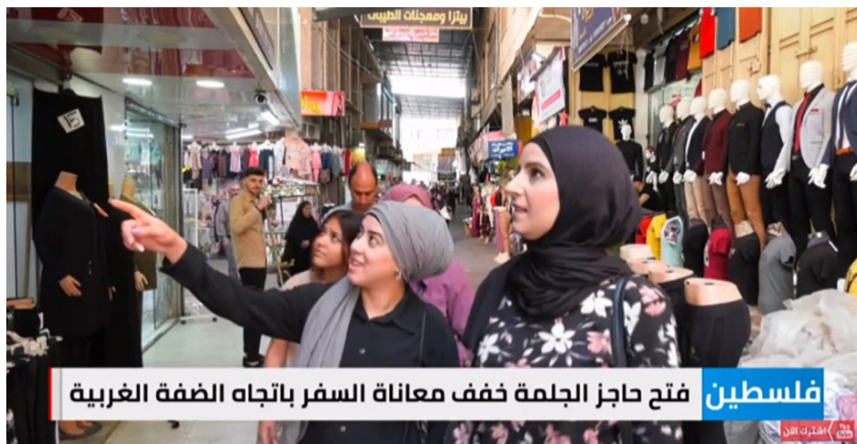
ערבים ישראלים עושים קניות בג'נין, יוני 2021