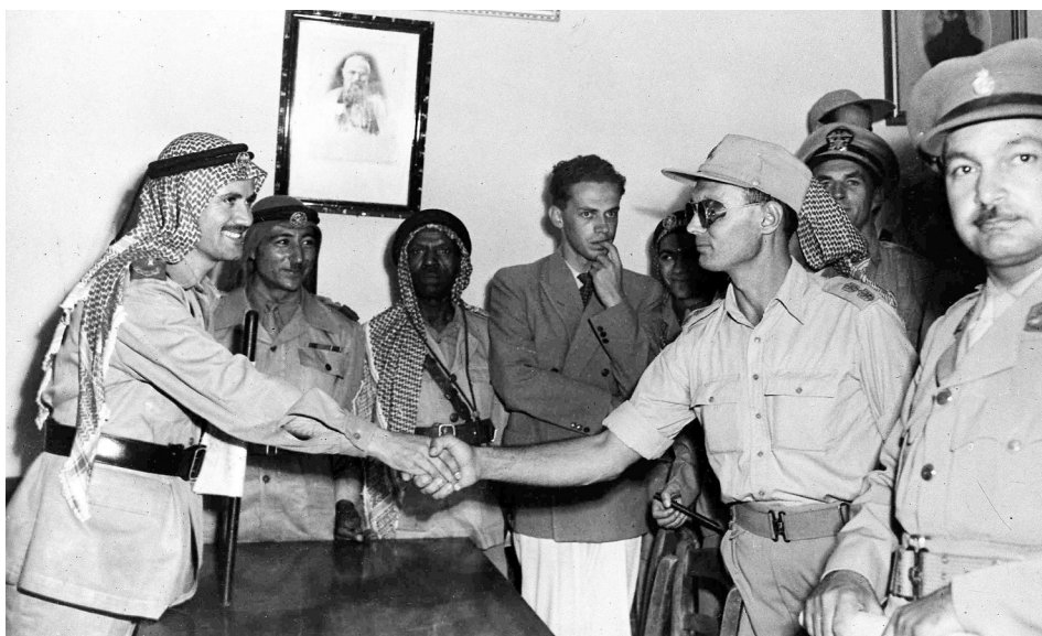
מפקד חטיבת ירושלים אל"מ משה דיין (מימין) ומפקד הלגיון הירדני עבדאללה א-תל לוחצים ידיים לאחר שנועדו במנזר בשטח ההפקר של ירושלים ב-22 באוגוסט 1948. מימין, בפניו אל המצלמה - סא"ל אחמד עבד עזיז, מפקד הכוחות המצריים בדרום ירושלים. שעות אחדות לאחר שצולמה התמונה נורה אל"מ עזיז ממארב ונהרג

לפעול באופן שיטתי נגד כל ביטויי האלימות והטרור; להנפיק היתרי החזקה ונשיאה של נשק בידי אזרחים; להחרים נשק המוחזק שלא כחוק, לעצור ולהעמיד לדין חשודים במעשי אלימות וטרור; להבטיח טיפול מידי, יעיל ואפקטיבי בכל אירוע הכרוך באיום או במעשה טרור, אלימות או הסתה, בין שנעשו בידי פלסטינים ובין שנעשו בידי