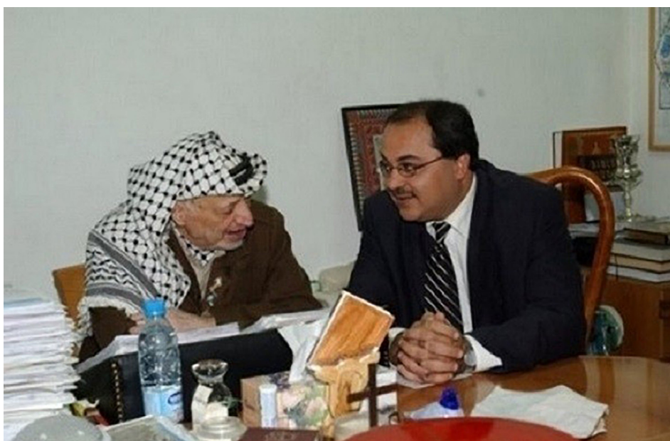
אחמד טיבי ויאסר ערפאת

במגזר הערבי בישראל יש חשש גדול עקב מינויו של איתמר בן גביר, ראש מפלגת "עוצמה יהודית", לתפקיד השר לביטחון לאומי, וזאת לנוכח הצהרותיו במהלך מערכת הבחירות בעניין החזרת המשילות בנגב והמלחמה בפשיעה במגזר הערבי. חששות אלו גברו בעקבות עלייתו להר הבית ב־3 בינואר 2023 והצהרותיו בדבר הצורך בשינוי הסטטוס קוו בהר הבית. החשש הוא שמדיניותו תצית גל חדש של מהומות במגזר הערבי ובערים המעורבות.