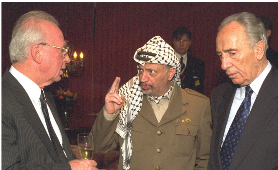
משמאל לימין: ראש הממשלה יצחק רבין, יו”ר אש”ף יאסר ערפאת ושר החוץ שמעון פרס

ה-CIA משתמש במונח ”Blowback” לתיאור השלכות לא מכוונות של מבצעים. המבצע החשאי לתמיכה במוגיאדין האפגני, שזכה לכינוי ”מבצע ציקלון”, נועד להפיל את המשטר הקומוניסטי שהשתלט על אפגניסטן. זו הייתה אסטרטגיית מלחמה קרה לעצירת התפשטות הקומוניזם, אך היא גרמה לערעור היציבות של אפגניסטן ולעליית הטליבאן ואל-קאעידה. ההשלכות הללו, שבקושי עלו על ”מפת המכ”ם” של ה-CIA, היו לגמרי לא מכוונות ובלתי צפויות. הן היו, במונחי ה-CIA, ”מכה לאחור”.