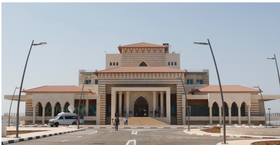
הארמון הנשיאותי של מחמוד עבאס בפאתי רמאללה, ובו מנחת מסוקים ובריכת שחייה, נבנה ב-2017 בעלות של כ-16 מיליון דולר. בעקבות ביקורת ציבורית הכריזו גורמים רשמיים ברשות כי הבניין יכיל גם את הספרייה הלאומית הפלסטינית