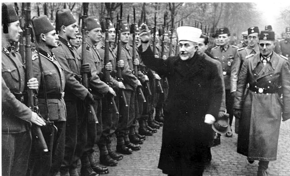
נובמבר 1943: אמין אל-חוסייני מברך במועל יד חיילים בוסנים שהתנדבו לשרת באס-סא

אבו מאזן, יו"ר סיעת פת"ח "המתונה והחילונית" של אש"ף, והעומד בראש הרשות הטרום-מדינתית בעלת ההכרה הבינלאומית, הרשות הפלסטינית, קיצוני ברטוריקה שלו לא פחות מיריביו בחמאס. הכחשת השואה מצד אבו מאזן ותיאוריות הקונספירציה היהודיות ה"נאציות" שהוא מחזיק בהן מתוארכות לעבודת הדוקטורט שלו מ-1968 בחסות הסובייטים, שעדיין מבוקשת כיום וזמינה במרשתת בערבית. בספרו "הפנים האחרות: הקשרים החשאיים בין הנאצים לציונות" הוא טען כי המספר הנקוב של שישה מיליון קורבנות השואה מוגזם, וכי מנהיגים ציונים שיתפו פעולה עם הנאצים. 22 אבו מאזן לא חזר בו, ובאוגוסט 2022, בנאום שנשא בגרמניה בנוכחות הקנצלר אולף שולץ במלאת 50 שנה לרצח הספורטאים הישראלים באולימפיאדת מינכן ב-1972 בידי מחבלים פלסטינים, טען אבו מאזן כי הנכבה, "האסון" של עקירת ערבים פלסטינים במהלך מלחמת העצמאות של ישראל (1947-1949), שווה ערך ל"חמישים שואות". על כך זכה לגינוי נרחב, כמו ב-2016 על עלילת הדם שהעלה לפני מנהיגי אירופה. 23 את הדוגמאות שלעיל אי-אפשר לתלות רק בתסכול פלסטיני ארוך-שנים מתהליך שלום כושל: נציגי הרשות הפלסטינית הפריחו אמרות אנטישמיות בעיצומו של תהליך השלום בשנות ה-90. 24 יו"ר הרשות הפלסטינית יאסר ערפאת העלה תמות אנטישמיות אסלאמיסטיות בנאום שנשא ב-10 במאי 1994 במסגד ביהנסבורג, קרא ל"גיהאד" לשחרור ירושלים ורמז כי הסכמי אוסלו הם מהלך טקטי הפיך. אף שדבריו אלו הציתו סערה פוליטית בישראל, 25 שר החוץ דאז של ישראל שמעון פרס התייחס אליהם בביטול. 26