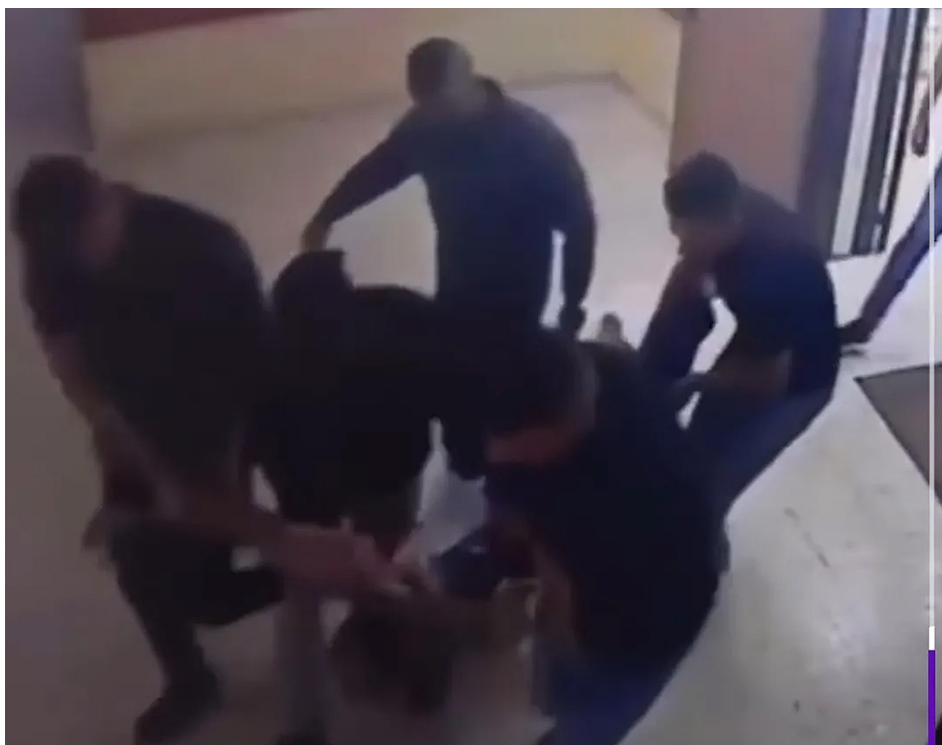
צילום מסך: אנשי מנגנוני הביטחון של הרשות הפלסטינית גוררים את בנאת לבית החולים, שם נקבע מותו. (YouTube/Middle East Eye)

התיאום הביטחוני בין כוחות הביטחון הפלסטיניים וישראל, למשל, הוסבר על ידי פלסטינים רבים כתוצאה ישירה של השחיתות של בכירים פלסטינים. הטענה היא שפקידים אלו, שחלקם נגועים בפרשיות שחיתות, אינם מעוניינים להפסיק את התיאום הביטחוני מכיוון שהם חוששים לאבד את תעודות ה-VIP שקיבלו מישראל ואת זכויות היתר שהם ובני משפחותיהם נהנים מהן עקב שיתוף הפעולה עם ישראל. התגברות השיח על שחיתות גרם לפלסטינים רבים לפקפק במניעים ובסיבות שמאחורי החלטותיהם של מנהיגים פלסטינים. אם, למשל, הרשות הפלסטינית מחליטה להקים בית חולים, השאלה הראשונה שפלסטינים רבים ישאלו היא מי ב"לשכת הנשיא" זכה לקבל עמלה בעקבות הפרויקט. כך גם בנוגע ל"תהליך השלום" עם ישראל. בכל פעם שישראלים ופלסטינים נפגשו ליד שולחן המו"מ כדי לדון בדרכים להתקדמות, צצו דיווחים ושמעות ברחוב הפלסטיני על ההטבות והתגמולים שהוצעו לפקידים פלסטינים מסוימים (מצד ישראל וארה"ב) בתמורה לויתורים מרחיקי לכת לטובת ישראל. דיווחים ושמעות אלו לא נפלו על אוזניים ערלות: למעשה, הם מילאו תפקיד בהרתעת מנהיגים פלסטינים מעשיית ויתורים של ממש למען השלום עם ישראל.